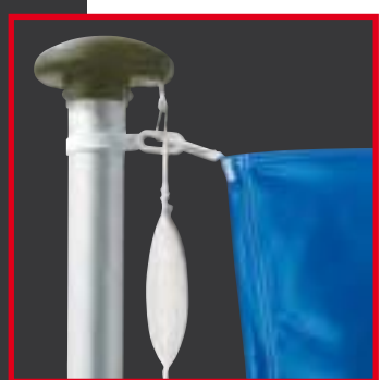
Mastkopf mit Gewicht